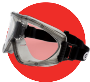
EGON 8226 Art. n° 7.78.225.00