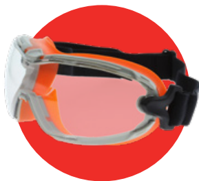
X-VIEW-COMFORT 8240 Art. n° 7.78.240.00