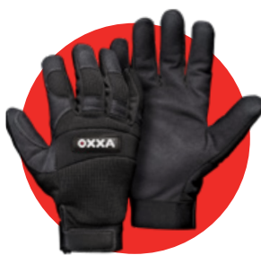
X-MECH 51-600 Art. Nr. 1.51.600.00