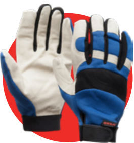
BALD-EAGLE-WINTER 47-166 Art. Nr. 1.47.166.00