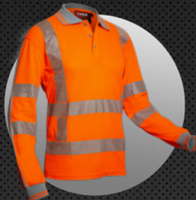
X-VIZ-COMFORT-LONG 6220 RWS Art. n° 2.76.211.00