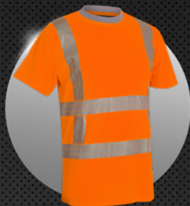
X-VIZ-FLEX 6200 RWS Art. n° 2.76.201.00