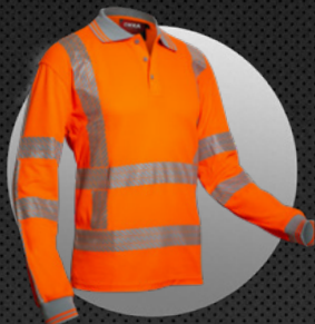
X-VIZ-COMFORT-LONG 6220 RWS Art.-Nr. 2.76.211.00