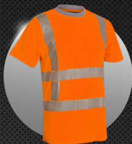
X-VIZ-FLEX 6200 RWS Art.-Nr. 2.76.201.00

X-VIZ-CAP 6230 SWEATER MIT KAPUZE RWS Art.-Nr. 2.76.231.00