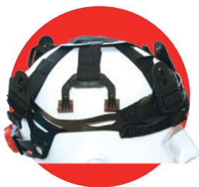
PRAIA 8215 Art. n° 6.78.215.00