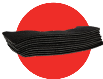
KIGALI 8205 Art. n° 6.78.205.00