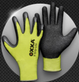
X-GRIP-LITE 51-025 Art. n° 1.51.025.00