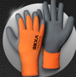
X-GRIP-THERMO 51-850 Art. n° 1.51.850.00