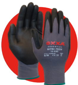
NITRI-TECH 14-690 Art.nr. 1.14.690.00