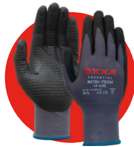
NITRI-TECH 14-695 Art.nr. 1.14.695.00