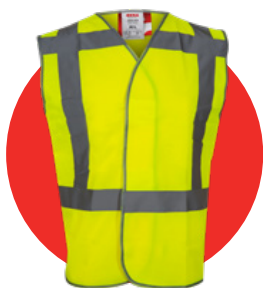
ANIKA 0175 Art. nr. 2.60.175.00