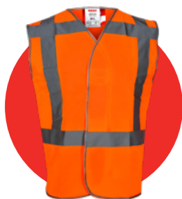
ANIKA 0175 Art. nr. 2.60.177.00